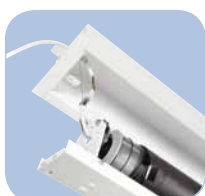
Mecanismo de fijación en la carcasa