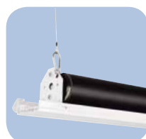
Componentes y Tela de Pantalla