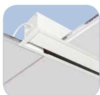
Perfecta integración en el techo