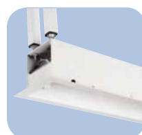
Carcasa de la pantalla