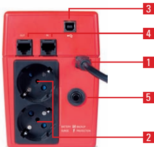
► Modelos 400 / 600 / 800