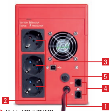
► Modelos 1.000 / 1.400 / 2.000