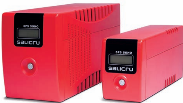
► Equipos SPS SOHO

La serie SPS SOHO de SALICRU reúne todas las prestaciones necesarias para una protección mejorada de los equipos informáticos. La serie SPS SOHO son sistemas de alimentación ininterrumpida (SAI/UPS) de tecnología line-interactive disponible en las potencias de 400, 600, 800, 1000, 1400 y 2000 VA. La estabilización permanente de la tensión de entrada provoca un menor uso de las baterías para obtener la autonomía máxima en caso necesario. También incorporan, para una mejor integración en el entorno protegido, comunicación vía USB con un completo software de monitorización y control capaz de autoapagar los sistemas informáticos en caso de cortes prolongados. Asimismo, incorporan, de serie, un potente display con las informaciones de tensión de entrada, tensión de salida, nivel de carga, nivel de baterías y estado de funcionamiento. Y para una protección completa incluye un filtro para la línea de datos/módem/ADSL. Todas estas características los convierten en la solución SAI con mejor relación calidad/precio del mercado.