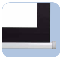
Barra inferior triangular que se oculta en la carcasa