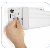
Accesorios Plug and Play