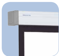
Pantalla de proyección de calidad profesional con una amplia gama de posibilidades