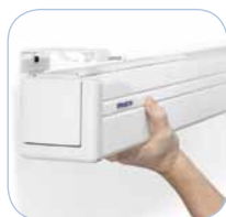
Sistema Easy Install con soportes metálicos