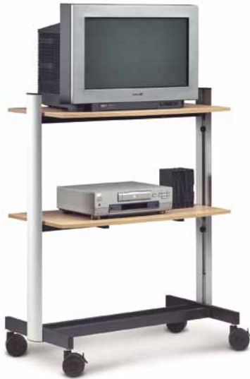
LISTA DE PRECIOS P 145