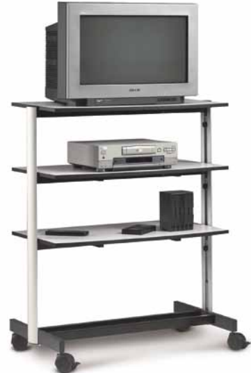
LISTA DE PRECIOS P 146