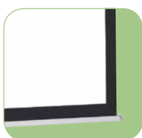
Barra inferior triangular