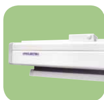
Sistema Easy Install con soportes de plástico